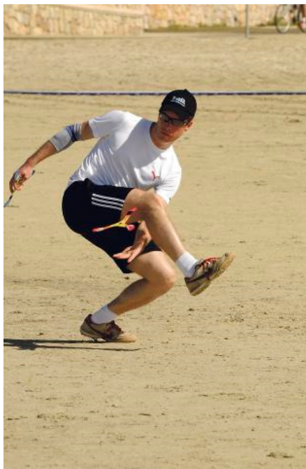
Elegant fängt Weltmeister Fridolin Frost den Bumerang zwischen den Beinen.

Egal wie der in Bremen lebende Wirtschaftsingenieur seinen Bumerang auch wirft, er kommt jedes Mal punktgenau zu ihm zurück. Frost fängt ihn lässig hinter dem Rücken, zwischen den Beinen oder im Liegen mit den Füßen. Selbst beim Doppelwurf, bei dem zwei unterschiedlich schnell durch die Luft fliegende Bumerangs auf die Reise geschickt werden, klappen alle Disziplinen bravourös.